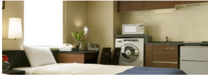
「東急ステイ水道橋」 客室内の洗濯乾燥機・電子レンジ等

「メインターゲットである「出張」「研修」「通勤時の一時住まい」「ご自宅の建替え時の仮住まい」「入院患者の長期付添い介護」の中長期滞在客に加え、都内の観光、海外からの旅行者など『1泊から長期滞在まで快適な空間』を提供することをコンセプトとして洗濯乾燥機・電子レンジ・ミニキッチン(部屋タイプにより異なる)などを客室内に設置したホテルです。